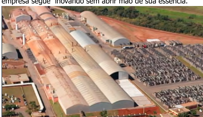
Incefra completa 55 anos com uma trajetória guiada pela inovação e qualidade

que marcaram seu início. Com os olhos voltados para o futuro, a empresa segue inovando sem abrir mão de sua essência.