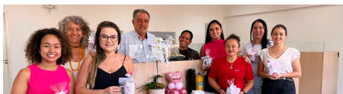
Atividade foi realizada na CoopAspacer

Na manhã de hoje, a Associação Paulista das Cerâmicas de Revestimento (ASPACER), reuniu mulheres de todos os setores da entidade para um café da manhã especial, em comemoração ao Dia Internacional da Mulher. A iniciativa, realizada nas instalações da ASPACER, teve como objetivo homenagear todas as mulheres que atuam na Aspacer e na CoopAspacer.