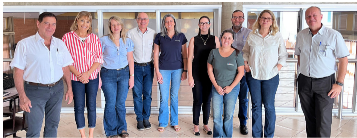
O Grupo se reúne mensalmente na sede da ASPACER.