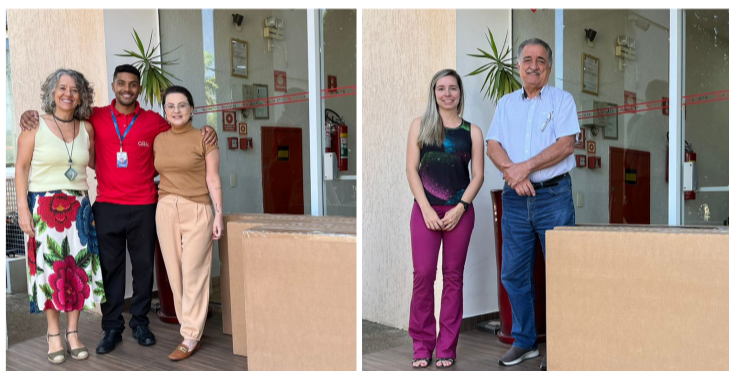
Aparelhos foram entregues na sede da ASPACER

O projeto consiste na doação de três Smart TVs de 50 polegadas para cada empresa associada de acordo com seu calendário de atividades. Nesta última semana, os aparelhos foram entregues para a Cerâmica Savane e o Grupo Ceral. A sequência de doação acontecerá agora em função do calendário de eventos da SIPAT/2023 que é transmitido à secretaria do SINCER, por meio dos Departamento de Recursos Humanos das empresas associadas.