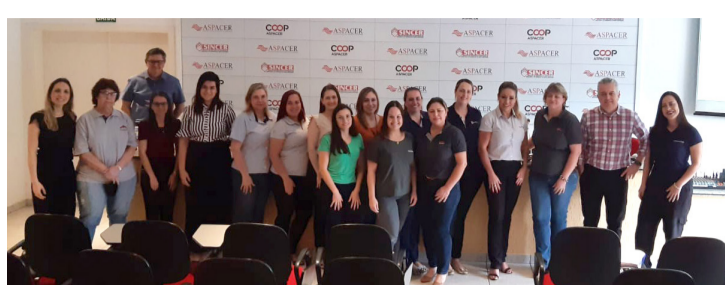
O encontro aconteceu por meio do Grupo de Excelência de Recursos Humanos

dou a Captação de Recursos via Finep, visando um financiamento muito mais barato do que por intermédios de Bancos e com maior carência, contando com todo o suporte de uma Consultoria Full Service.