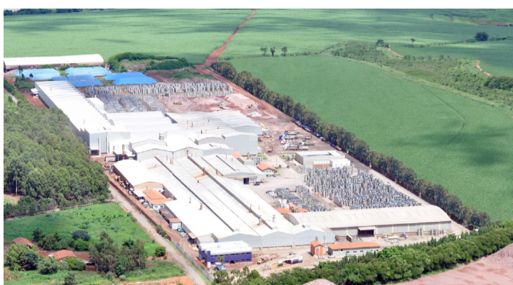
Grupo se destaca com modernas linhas de produção

em uma produção mensal que ultrapassa a marca de 3.200.000 metros quadrados, abrangendo um amplo mix de produtos que atendem às necessidades dos mais diversos projetos e clientes.