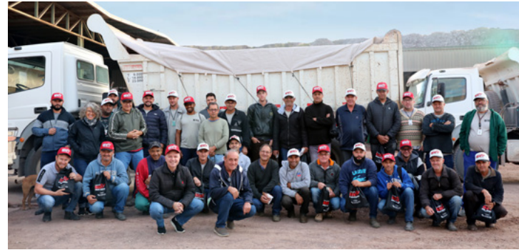
Caminheiros recebendo o kit, durante mobilização da campanha na Cerâmica Delta Porcelanato

A campanha "Caminhoneiro do Bem Anda Lonado" conta com o apoio das Prefeituras Municipais de Cordeirópolis, Ipeúna, Rio Claro e Santa Gertrudes, além do suporte do SEST SENAT, fortalecendo a parceria e o compromisso com a conscientização e a segurança no transporte de carga nas estradas.