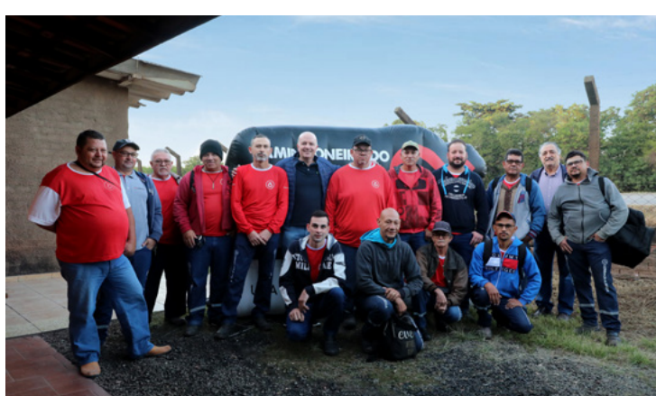
Os kits, compostos por camiseta, boné e material educativo estão sendo distribuídos em todas as cerâmicas do Polo de Santa Gertrudes.

A campanha “Caminhoneiro do Bem anda Lonado”, conta ainda com o apoio das Prefeituras Municipais de Cordeirópolis, Ipeúna, Rio Claro e Santa Gertrudes, bem como do SEST SENAT.