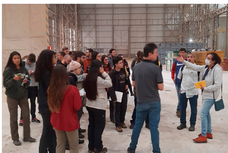
A visita guiada proporcionou aos estudantes uma visão abrangente de todo o processo fabril

Na última quarta-feira, 14, 31 alunos do curso de Geologia da UNESP de Rio Claro embarcaram em uma jornada educativa para explorar o fascinante universo do Polo Cerâmico de Santa Gertrudes. A visita proporcionou aos estudantes uma experiência única, oferecendo um vislumbre do processo de produção de cerâmica e porcelanato. Acompanhados pela Associação Paulista das Cerâmicas de Revestimento (ASPACER), os alunos foram conduzidos ao Centro Cerâmico do Brasil (CCB). Lá, eles foram apresentados aos detalhes e à tecnologia avançada envolvidos na produção de materiais cerâmicos de alta qualidade. Após a imersão no CCB, os alunos seguiram para a fábrica da Nova Porcelanato. Lá, tiveram a oportunidade de explorar a linha de produção em pleno funcionamento. Eles puderam ainda acompanhar o processo, bem como interagir com os funcionários e entender os desafios e as inovações da indústria cerâmica.