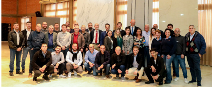
Atividade aconteceu nesta última quinta-feira

ainda uma redução nos custos operacionais.