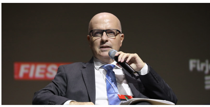
ASPACER tem trabalhado para promover pautas que visam a abertura do mercado livre de energia

Os setores residenciais e comerciais não sofreram alterações nos valores.