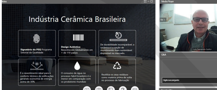
Painel foi realizado de forma on-line e contou com mais de 450 inscritos

O painel contou ainda com participação de pesquisadores e consultores ligados ao setor de energia.