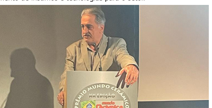
Evento aconteceu no Museu da Arte Moderna de São Paulo

Além das personalidades e profissionais homenageados, o evento também teve espaço para os fornecedores da indústria cerâmica, que desempenham um papel fundamental no fornecimento de insumos e tecnologias para o setor.