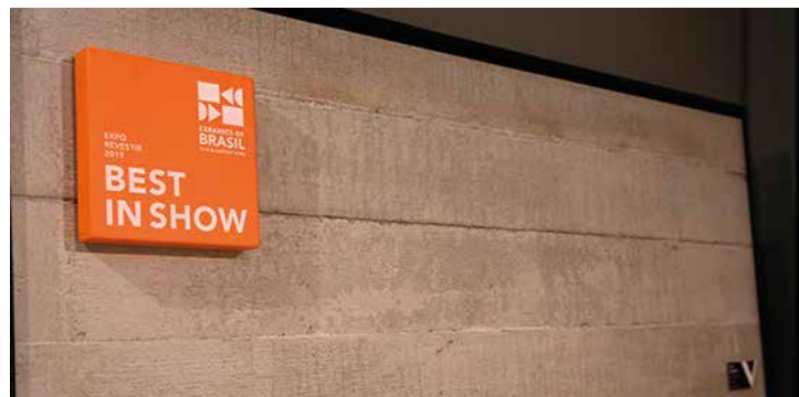
Cerâmica/Porcelanato Piso: Villagres - Porcelanato City Cement

Para saber mais sobre esses assuntos, entre em contato