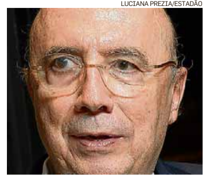
Meirelles. Defesa do ajuste